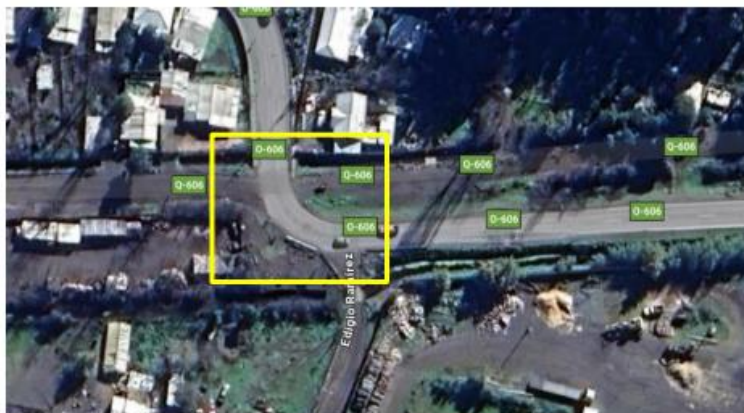
Imagen N°3 – Ruta Q-606

IMAGENES: Vista satelital del área de influencia del proyecto en que se ha demarcado los sectores a intervenir en la comuna.