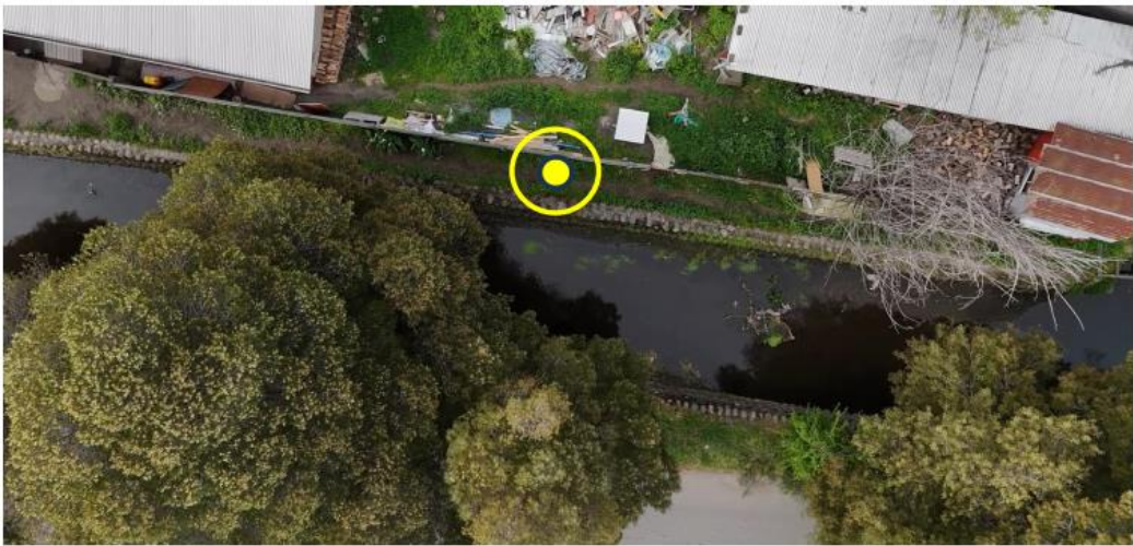
Poste N°12 – Poste 9m + Luminaria Solar