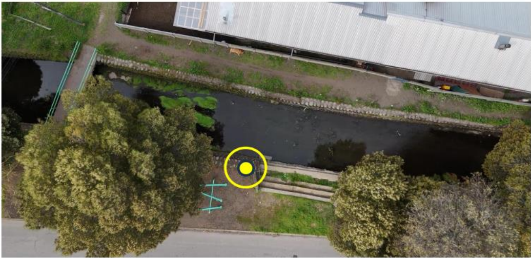
Poste N°11 – Poste 9m + Luminaria Solar