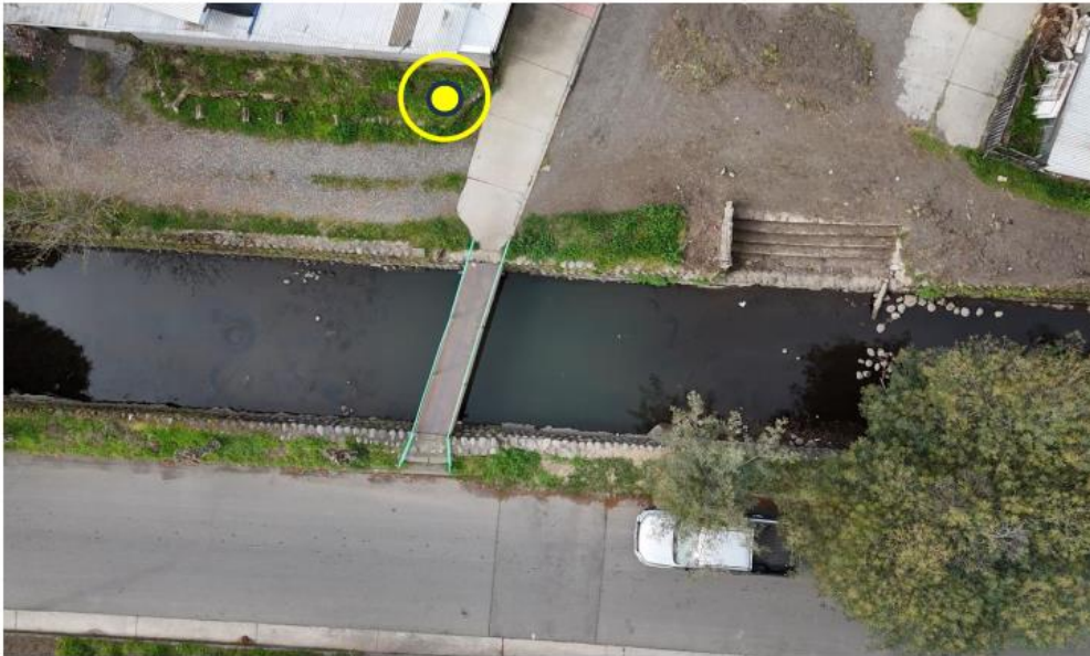
Poste N°14 – Poste 9m + Luminaria Solar